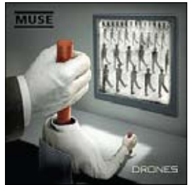
Muse Drones, 2015

Muse выпустили новый альбом, и это, безусловно, событие в мире современной музыки. Миллионы поклонников Меттью Беллами и его команды ждали от альбома 2015 года ответа на главный для них вопрос: в каком направлении будет развиваться группа. Дело в том, что после первых исключительно песенных альбомов коллектив вдруг запал на большие формы. И если в альбоме 2006 года Black Holes & Revelations композиция Knights Of Cydonia была абсолютным шедевром, то об остальных «больших» вещах это сказать трудно. И Exogenesis Symphony с альбома 2009 года The Resistance, и The 2nd Law с одноименного диска 2012 года больше заставляли говорить о чрезмерном увлечении группой Queen, но никак не о творческой самостоятельности.