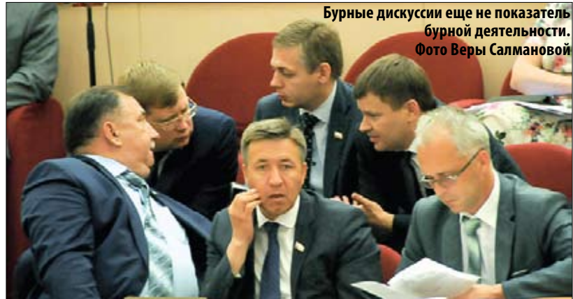
Бурные дискуссии еще не показатель бурной деятельности.

К слову сказать, реакция на этот не совсем дружеский шарж была странной. Вместо того чтобы быстренько привезти щебень и асфальт и заделывать дыру, портрет сначала пытались смыть. Когда акция по уборке улицы не удалась, народное творчество примитивно закрасили. И уже потом, ближе к вечеру, дыру засыпали землей и заасфальтировали. Но где гарантия, что этот красочный слой не смоем первым дождем или второй поливальной машиной: город в этом году подвергают влажной уборке регулярно. И кто может быть уверен в том, что засыпанную землю под слоем асфальта не размоют подводные течения и что провал не образует-