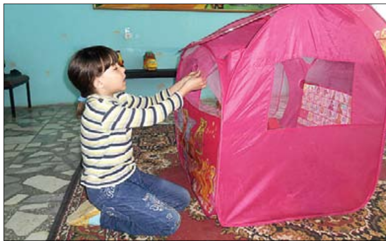
Маленьким пациентам есть чем заняться в игровой комнате

На сайте больницы перечислены специальности врачей, которых не хватает медучреждению. Причем больница, привлекая докторов, готова предложить определенный перечень социальных условий: одновременную вы-