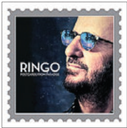
Ringo Postcards From Paradise, 2015

Когда-то давным-давно, когда Джордж Харрисон только выпустил All Things Must Pass, я прочитал в музыкальном журнале обзор сольного творчества бывших участников The Beatles. Не будем вспоминать, что там писалось о первых сольных пластинках Пола, Джона и Джорджа, — не о них сейчас речь. Но о Ринго Старре. Так вот, об ударнике великой группы там было сказано благожелательно, но одновременно и снисходительно: «Старине Ринго достаточно влезть за ударную установку и по-кряхтеть — слушатели воспримут это с восторгом».