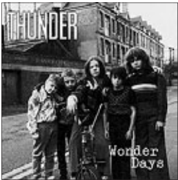
Thunder Wonder Days, 2015

Группа Thunder («Гром») не самый популярный в России музыкальный коллектив. Возможно, бенд заслуживает лучшей участи. Но всё дело в том, что интерес к Thunder возник у нас несколько странным образом. Сначала было, то есть была группа Union. Хотя нет, так мы совсем всех запутаем. Лучше давайте по порядку. Сначала, в 1989-м, образовался «Гром». И достаточно ярко дебютировал: первый их диск Back Street Symphony — блюз-рок плюс нежные баллады — вошел в хит-парад Соединенных Штатов под 21-м номером. А следующий — Laughing At The Judgement Day — стал вторым в США и 33-м в Великобритании. Не могу утверждать, что музыка дальше становилась хуже, но чартовые позиции снижались. Возможно, этим и обусловлено, что в 1999 году группа взяла перерыв, можно даже сказать, распалась. Вновь музыканты сошлись в 2003-м году, выпустили четыре альбома, лучший из которых — Robert Johnson Thombstone. Название, сами видите, говорит о блюзовой направленности. И тут Thunder снова распался.