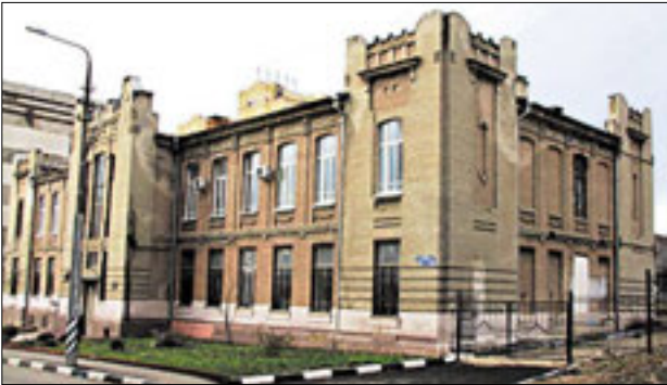
Торговая школа сегодня

спектора школы — с таким расчётом, чтобы в будущем при необходимости её можно было переоборудовать в дополнительные два класса. Стены здания выполнялись из красного кирпича, с частичной разделкой из белого. Полы в классах, учительской, библиотеке и рекреационном зале должны были быть паркетные, в других помещениях досчатые и терракотовые, а в подвале частично асфальтовые. Смета была подписана Г. Г. Плотниковым 12 мая 1910 года.