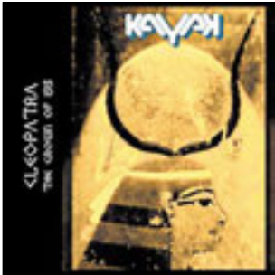
Kayak Cleopatra — The Crown Of Isis

Такова наша доля, что всё начало года будем мы писать о пластинках, вышедших в 2014-м. Дело не только в дефиците материала, но и в том, что есть действительно интересные работы.