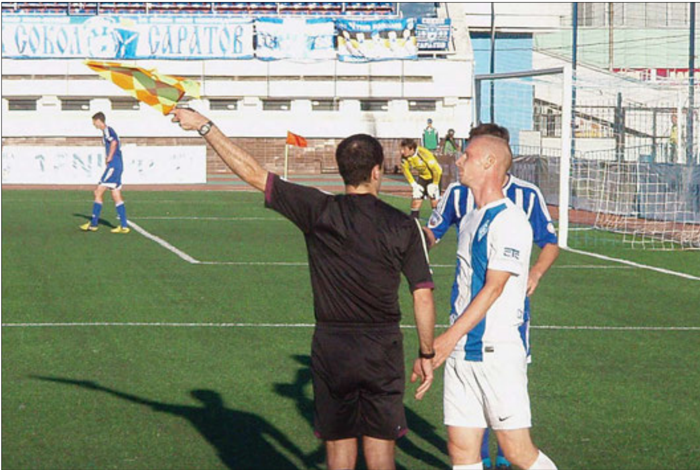
Многие саратовские команды могут оказаться вне гранта, а значит, и вне игры

Областное министерство молодежной политики, спорта и туризма намерено выделить «игровикам» 100 миллионов рублей на всех