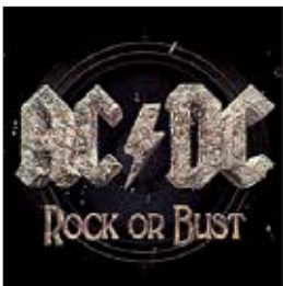
К «AC/DC» Rock or Bust, 2014

Какое, милые, у нас тысячелетие на дворе? Это я к тому, что прочитал в Интернете такую запись: «Новые «Космические войны», новый «Терминатор», а теперь еще и новая пластинка AC/DC. Боже, в каком году я живу?» Да нет, всё нормально, за свою психику можно не беспокоиться. Реально, подходит к концу 2014 год, но чем это может помешать тому, что выйдут новые «Звездные войны» и «Терминатор», а AC/DC записывают новый диск? Может, это свидетельство того, что старое вино — лучше, пусть и разлито в сто пятый раз? А новое еще как следует не перебродило.