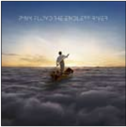
Pink Floyd Endless River, 2014

И тогда Дэвид Гилмор сказал: «Это будет последняя вещь от нас... Обидно, конечно, но это конец». Так была перевернута одна из ярчайших, без всякого преувеличения золотых страниц в истории рок-музыки. Выпустив альбом, два оставшихся участника группы — Дэвид Гилмор и Ник Мейсон — заявили, что более ничего нового под названием группы выпущено не будет. Одна из величайших рок-групп мира прекратила свое творческое существование. Тут впопору со слезой добавить, что Флойд навсегда останется в наших сердцах. И это будет сущая правда.