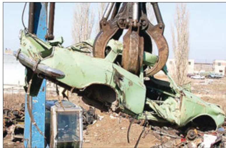
«Москвичу-69» не помешала бы хорошая встряска в виде справедливого судебного решения