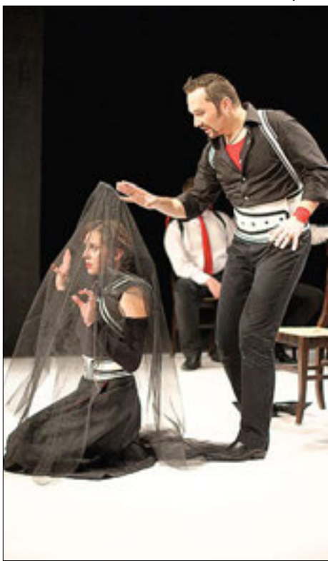
Сцена из спектакля «С любовью не шутят»

и бывшая актриса театра драмы, сказала, что Петр Наумович планировал поставить эпилог романа, но почему-то это не сделал, а кроме того, очень любил историю батареи Тушина, считал ее одной из наиболее эмоциональных частей романа. Но и с ней не сложилось.