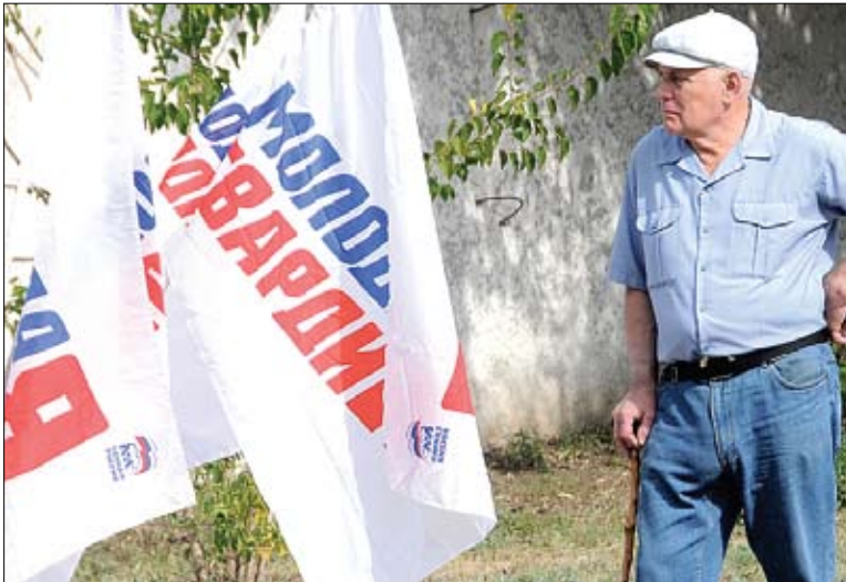
Хочется, ох, хочется нашему эксперту, задрать штаны, бежать за комсомолом! Еще ведь и перегнуть может!