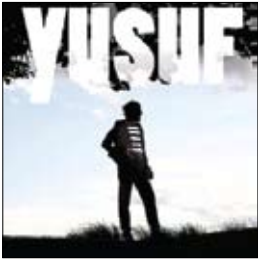
Yusuf Tell 'Em I'm Gone, 2014

Когда давным-давно — хорошее начало для сказочки, верно? — я увлекался тяжелым роком и даже металлом. Ладно Metallica, Iron Maiden, но в моей коллекции тогда были и Anthrax, и Slayer. Зашел ко мне друг — тоже меломан. Чуть постарше меня. Послушал очередной металлический боевик, поморщился и сказал: «Всё равно придет время, когда ты увлечешься блюзом. И будешь слушать не этих монстров, а старых негров с акустическими гитарами». Прошли годы, и выяснилось, что он оказался прав. Правда, Metallica и Iron Maiden до сих пор остаются в сфере моего внимания. Однако блюз, несомненно, на первом месте.