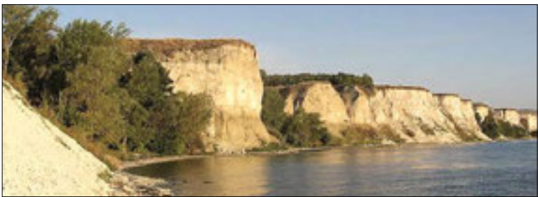
Утес Степана Разина