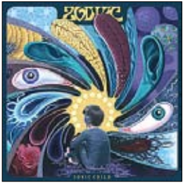
Zodiac Sonic Child, 2014

Знаете ли вы группу Zodiac? Любители со стажем могут ответить, что знают, конечно, группу «Зодиак», созданную в Латвии и считавшуюся нашим ответом на популярную тогда французскую группу Spase. Электронная музыка, звуки космоса и так далее.