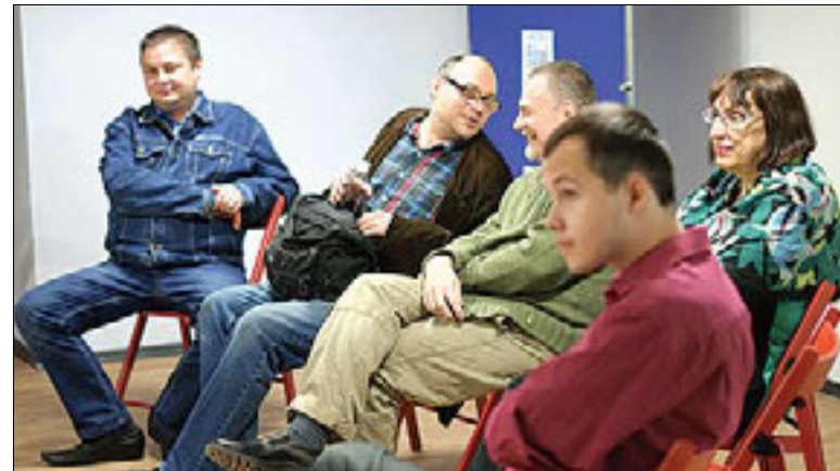
Участники круглого стола «Региональная литература»