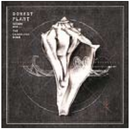
Robert Plant Lullaby And ... Ceaseless Roar, 2014

Есть музыканты, которых даже самые преданные фанаты хотели бы видеть в ином качестве. Певца Роберта Планта, например, только в составе Led Zeppelin. Да и сам Плант время от времени делает намеки о возможности реюниона группы. А потом берет да и отказывает старому другу Джимми Пейджу в воссоздании группы, утверждая, что ему скучно играть старую музыку. И каждый раз действительно поет что-то новое (или хорошо забытое старое). Так, дуэтом с кантри-певицей Аллисон Краусс Плант выпустил альбом Raising Sand 2007 года, потом вновь вернулся на фолк-территорию с пластинкой Band Of Joy — 2010-го. Оба диска были милы, но не более того. В новом альбоме Роберт решил поиграть этническую музыку, прежде всего западноафриканские транссовые мелодии.