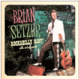
Brian Setzer «Rockabilly Riot!», 2014

Совсем редкий зверь забрел в наши чащобы. И имя тому зверю — рокабилли. Представляю, как морщатся убеленные сединами критики, которым подагра и одышка не позволяют встать из кресла. Рокабилли — это тот самый жанр, который сохранил первобытный огонь рока. Еще поднимается от этого огня легкий дымок ковбойских костров. Короче, рокабилли — это рок с некоторыми элементами кантри. Термин «рокабилли» происходит от слов «рок» и «хилбилли» (одно из названий музыки кантри). Рокабилли зародился в южных штатах США в начале-середине 1950-х годов. Отца этой музыки знает весь мир, даже далекий от музыки, ибо это Элвис Пресли. А кроме него были Билл Хейли (помните Rock Around the Clock), Джонни Кэш, Рой Орбисон Карл Перкинс, Джерри Ли Льюис, Бадди Холли и много других великих людей. Под влиянием рокабилли сформировались такие группы, как Beatles и Rolling Stones. По сути рокабилли стал отцом всей современной рок-музыки. Потом папашу стали подзабывать. Считать таким простоватым стариканом. И соответственно, как пишут в музыкальной прессе, рокабилли имеет лишь ограниченный круг стойких поклонников.