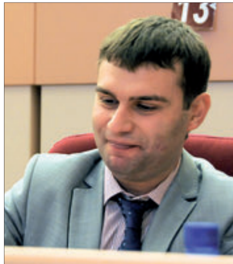
Самый молодой депутат Александр Гайдук

Понятно, найти автора и тем более заказчика не удастся. Чем закончатся пока еще вяло ведущиеся военные действия, неизвестно. Зато очевидно, что всё тайное становится явным.