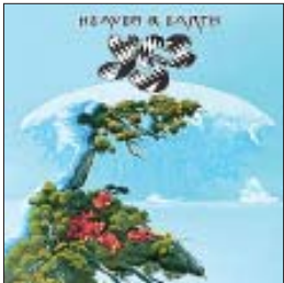
Yes Heaven & Earth, 2014

Год, что ли, такой выдался, монстры рока герои шестидесятых-семидесятых чуть ли не каждую неделю выпускают новую работу. Есть два варианта, как писать о таких дисках. Или безудержно хвалить, если работа очень хороша, просто хороша или, что называется, неплоха. Второй вариант, когда старики в силу тех или иных причин не напрягались, надо писать примерно так: ну что же, великие люди, имеют право. В нашем случае получается третий вариант.