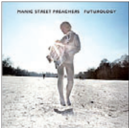
Manic Street Preachers Futurology, 2014

Есть такой великий роман бразильца Жоржи Амаду — «Тезиса Батиста, уставшая воевать». Конечно, где Бразилия, а где Уэльс, кто для мировой культуры Дин Брэдфилд и кто Амаду. Но есть тут один нюанс: Брэдфилд и его команда никогда не устают воевать. Может, недаром группа и носит свое название — «Маниакальные уличные проповедники».