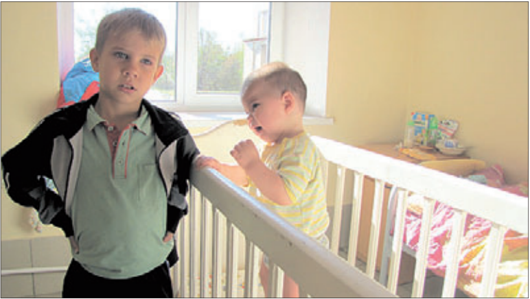
Маленькие пациенты больницы

Конечно же, это положительно сказывается на кадровой политике. Так, за шесть месяцев 2014 года к нам на работу прибыло три врача и три средних медицинских работника. В течение ближайших двух месяцев ожидается прибытие еще трёх специалистов.