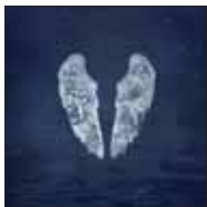
Coldplay Ghost Stories, 2014

Странное дело: всю последнюю неделю занимался совсем несвойственным делом — защищал последний альбом не самой любимой своей группы от... поклонников этой группы. От знакомых, сына и даже — заочно — от музыкальных критиков. Упреки фанатов сводились в принципе к одному: альбом слишком меланхоличен. Можно подумать, предыдущие работы коллектива искрили весельем. Еще один неожиданный упрек: альбом слишком личный — он весь посвящен расставанию лидера группы Киса Мартина с его женой актрисой Гвинет Пелтроу. Тоже непонятный упрек. Настоящая рок-музыка тем и хороша, что — в отличие от попсы — музыканты поют не о выдуманных авторах текстов любовях, а о своем, о личном. Наконец, последний из основных упреков этому концерту в том, что Мартин поднимал под себя группу, пластинка выглядит его сольным альбомом, а остальные музыканты — глубоко в тени. Позвольте, Coldplay всегда был коллективом с ярко выраженным фронтом, увидеть это только сейчас — значит просто ничего не знать о них.