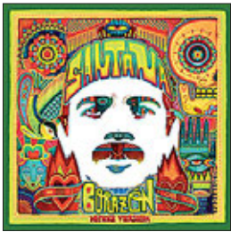
Carlos Santana Corazon, 2014

Итак, еще один матерый человечище. И опять-таки из той же плеяды рок-музыкантов, что могли бы давно уже ничего не делать. Разве что раз-два в год выйти на каких-нибудь сборных концертах и парой соло напомнить миру о себе. Но старики опять идут в бой. Правда, надо отметить, что в последнее время Карлос Сантана всё время попадал в истории, будто подсмотренные в мексиканских сериалах. То прямо на концерте делает предложение руки и сердца своей барабанщице. То журналисты отыщут на лос-анджелесской свалке его бывшего перкуссиониста, опустившегося и спившегося. И Карлос мчится на эту свалку. Обнимает товарища, лечит его и возвращает к нормальной жизни. Единственное, чего не знаю, — участвовал ли этот музыкант в записи последнего альбома Сантаны.