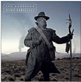
Ian Anderson Homo Erraticus, 2014

И вот диск поставлен на вертушку, с замиранием ждешь первых аккордов. Сначала звучат струнные (электронные), а потом — флейта и такой знакомый вокал. Да, это Jethro Tull, хотя на обложке поставлено имя Иэна Андерсона. Однако давайте говорить прямо: Jethro Tull всегда был группой одного человека, какие бы хорошие музыканты в коллективе ни играли. Тот же Мартин Барре, Дон Эйри и добрый десяток барабанщиков.