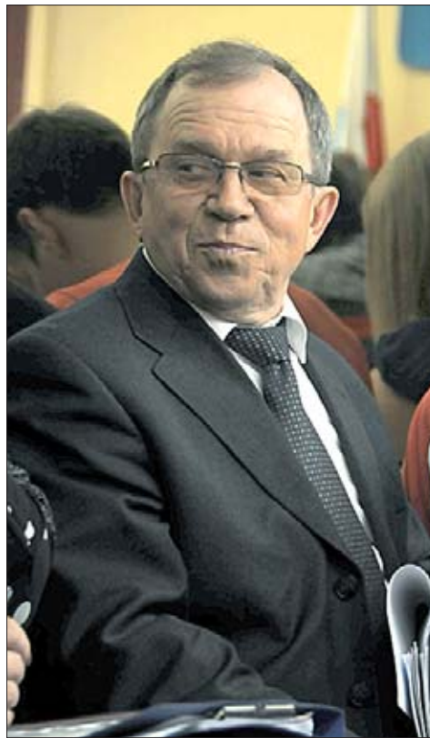
Министр Александр Ларионов

Лучших учителей федеральный центр поддерживал средствами в объеме 3,2 млн рублей, на развитие образования дали 5 млн. Берегу Бабушкиного взвоза в Саратове повезло больше. На него пришли 322 млн рублей. И