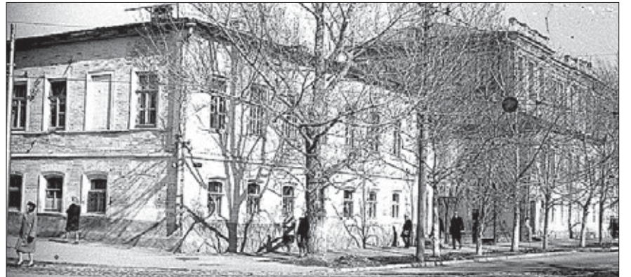
Вот этот угол и это здание. На заднем плане справа виден корпус нынешнего аграрного университета (ранее институт механизации сельского хозяйства) на Советской