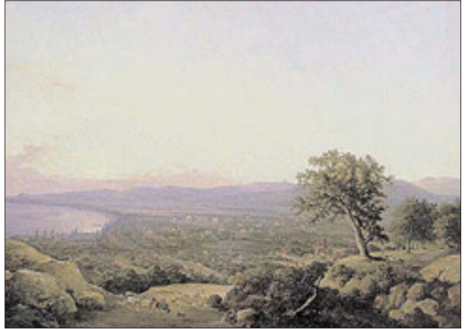
Н. Г. Чернецов. Вид города Саратова при закате солнца. 1860 год

своей [они] боролись то с разъяренными волнами, то с неодолимыми льдами». Язык «Путешествия» настолько живописен, что читатель с воображением и «видит», и «слышит» плеск воды, шум ветра, пение бурлаков, крики птиц, разноголосицу на причалах, громкие команды лоцманов.