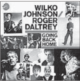
Wilko Johnson Roger Daltrey Going Back Home, 2014

Этот альбом, помимо своих, несомненно, высоких музыкальных качеств, интересен теми людьми, которые его делали. Роджер Долтри не нуждается в представлении — вокалист великих The Who. Вилко Джонсона в музыкальном мире знают меньше, пожалуй. Хотя его основная группа Dr. Feelgood еще с семидесятых годов пользуется заслуженным авторитетом. Прежде всего у любителей блюза.