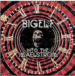
Bigelf Into The Maelstrom 2014