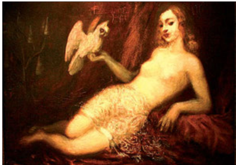
Венера с попугаем