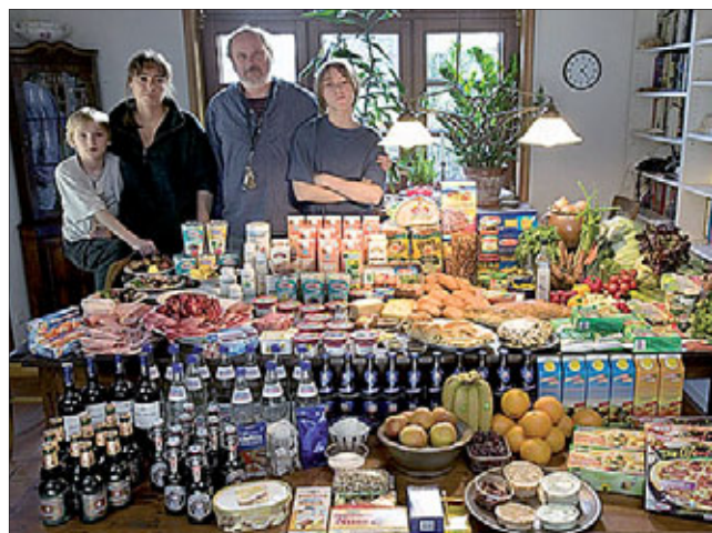
Семья из Германии. Затраты на еду в неделю: 500 долларов