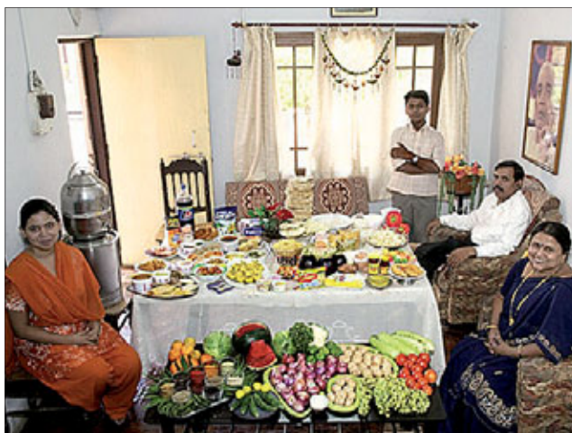
Семья из Индии. Затраты на еду в неделю: 39 долларов