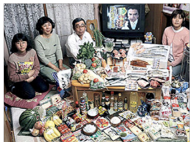
Семья из Японии. Затраты на еду в неделю: 317 долларов

Разворот подготовили Ольга Копшева, Дина Болгова, Гульмира Амангалиева, Роман Дрякин, Вячеслав Коротин. Продолжение темы — на стр. 14