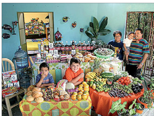
Семья из Мексики. Затраты на еду в неделю: 190 долларов

К тому же эти данные не просто берутся из головы, а тщательно проверяются. Эти цифры занесены в статистику, которая опубликована в «Российской газете». А за искажение официальной информации, как вы знаете, законом предусмотрена уголовная ответственность.