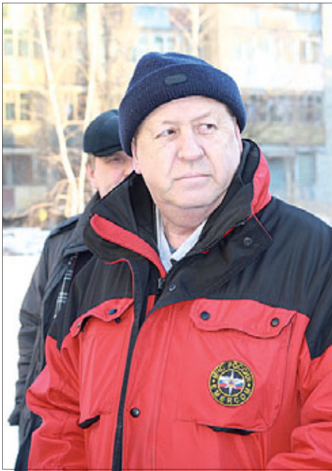
Ободренные жители всё лето занимались благоустройством зеленой зоны.

Тем не менее, вскоре жители получили гарантии от главы города Олега Грищенко, что никто ничего на этом участке не построит. Тогда же в качестве решения вопроса впервые прозвучало предложение предоставить застройщику на выбор другой участок земли, а этот забрать обратно в муниципальную собственность.