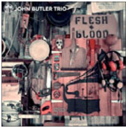
John Butler Trio Flesh+Blood, 2014

Итак, поздравим российских меломанов, им предстоит встреча с весьма интересным коллективом — австралийским трио имени Джона Батлера. Конечно, дебютантами на мировой музыкальной сцене трио можно называть весьма относительно: это уже шестой их альбом, а впервые они зашли в студию звукозаписи аж в 1998 году. За это время они снискали на родине бешеную любовь, на одном из музыкальных сайтов страны кенгуру и коал я даже нашел эпитет «богоподобные». Но и в остальном мире трио как минимум известно. Не будем задаваться вопросом, почему только сейчас мы знакомимся с ними, разговор о политике наших граммофонных фирм не имеет смысла.