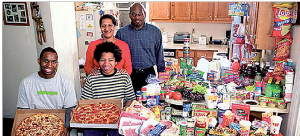
Семья из США, штат Северная Каролина. Затраты на еду в неделю: 342 доллара