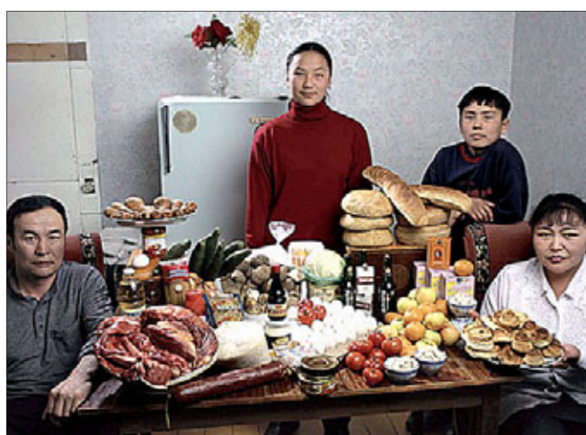
Семья из Монголии. Затраты на еду в неделю: 40 долларов