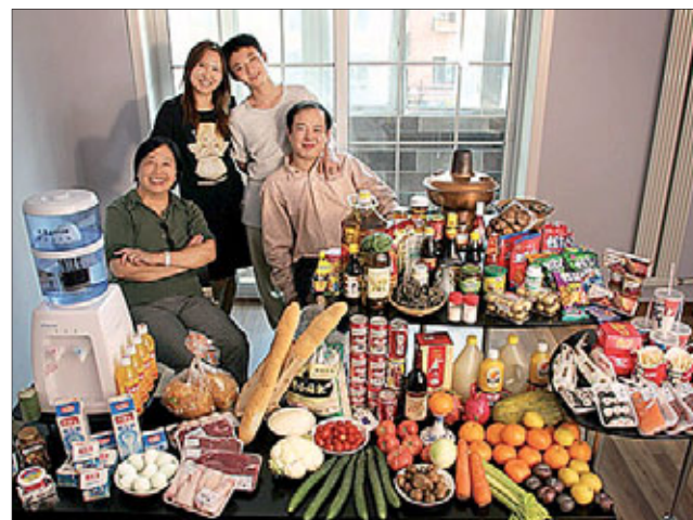
Семья из Китая, г. Пекин. Затраты на еду в неделю: 155 долларов