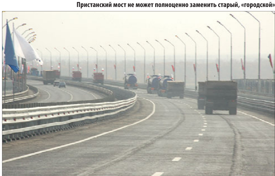
Пристанский мост не может полноценно заменить старый, «городской»

Так вот, на этой развязке, что у строительного рынка, и в стандартном режиме аварии не редкость. Что будет, если поток машин увеличится втрое? Или впятеро?