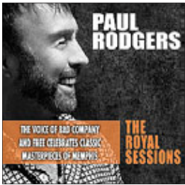
Paul Rodgers The Royal Sessions, 2014

Нет, ни в коем случае я не сектант в том, что касается моих музыкальных взглядов. Я очень толерантен: пусть расцветает сто цветов, как учат нас китайские товарищи. Ну разве что диско не считаю приличной музыкой, электронику очень не люблю, к соулу равнодушен. И, понятное дело, ненавижу попсу. А в остальном человек очень широких взглядов. Потому, когда узнал — еще в середине прошлого года, — что Пол Роджерс готовит альбом в стиле соул, не особенно встревожился. Роджерс — один из самых любимых моих певцов еще со времен Free и Bad Company. А его сольный альбом Muddy Waters Blues вот уже больше двадцати лет среди моих любимых.