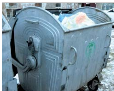
Что там греха таить! Все мы с вами — мусорообразователи