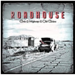
Roadhouse Gods & Highways & Old Guitars, 2014

Было несколько причин купить эту пластинку. Не из последних — посленовогодний голод на новую музыку. И несколько сериальных ассоциаций. Так, первая песня называется Hell On Wheels, а я смотрю одноименный сериал — про строительство железной дороги через прерию в середине века. Нет, не производственный, там всё круто: индейцы, интриги, любовь. Но песня к фильму не имеет отношения. И еще одна возникла ассоциация. Среди песен есть Katrina — так, между прочим, назывался ураган, буквально уничтоживший один из самых музыкальных городов планеты — Новый Орлеан. О жизни после Катрины снят хороший сериал — «Тремэ» (Treme) — по названию района. Наши переводчики почему-то произносят «Тремей», а название-то французское.