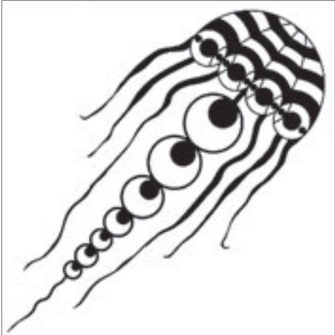
Горгона на поле ячменя в Англии

Собиратели этих свидетельств предполагают, что речь может идти о рентгеновском излучении нейтронной звезды, которая превратит всё живое в камень. Как тут не вспомнить взгляд Медузы Горгоны из греческой мифологии? Тем более что Не-что, напоминающее Медузу, появилось в виде 182-метрового рисунка на поле ячменя в Кингстоуне, Оксфордшир. Исследователи этих рисунков на полях расшифровали, что, вероятно, так выглядит звезда, которую сопровождает обширное газопылевое пылевое облако. А то, что звезда нейтронная, подтверждают 11 спутников в ее хвосте.