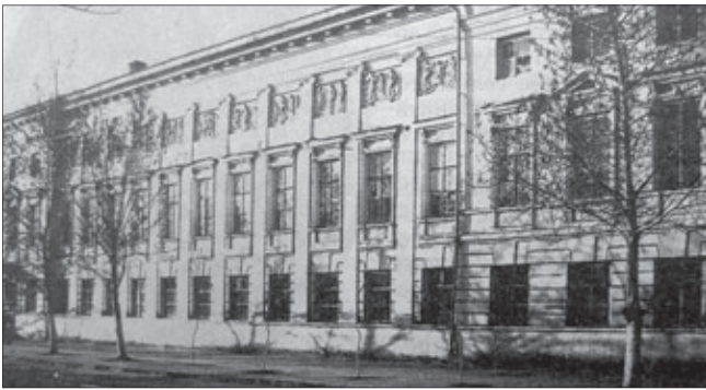
Дворянское депутатское собрание

Чаще всего балы и маскарады устраивались в дворянском собрании. Так называлось здание, в котором размещалось депутатское со-