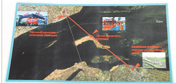
Улучшение транспортного сообщения между городами Саратов и Энгельс

Торговые комплексы и при них — канатная дорога