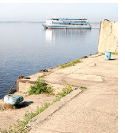
Причалная стенка всё лето отпугивала туристические теплоходы

5-е и 6 июня. В первый из этих дней Сергея Нестерова уволили из министров по делам территорий. На следующий день этот господин выиграл праймериз «Единой России» по Заводскому району, представив, как писали СМИ, полноценную предвыборную программу. Когда успел? Вообще данный господин обладает талантом на большой скорости перемещаться с должности на должность. Очевидно, незаменим.