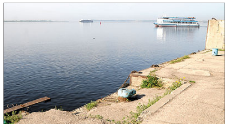
Причалная стенка всё лето отпугивала туристические теплоходы