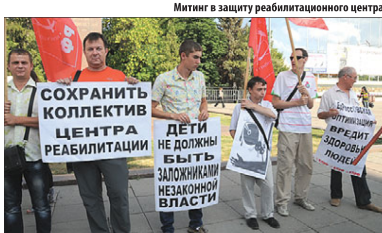
Митинг в защиту реабилитационного центра

Начата 5-го числа второго месяца. Поводом стала публикация очередного рейтин-