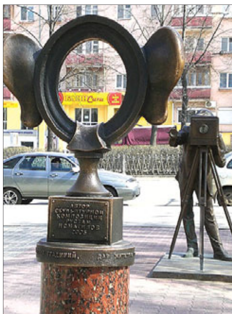
Культурная столица Европы

Пермь тоже хочет быть «культурной столицей». Причем у пермской культуры и властей амбиции лихо распространяются за пределы своего региона и даже страны. В их умах вызрела такая утопическая идея, что Пермь — то самое пустое место, на котором можно воздвигнуть — ни много ни мало — новую культурную столицу Европы.