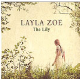
Layla Zoe The Lily, 2013

Перво-наперво не верьте обложке альбома. Там на пасторальной картинке девушка с рыжей косой идет по цветущему лугу. Не верьте в том смысле, что на диске вы не найдете и малой доли той умиротворенности, какую изобразил неизвестный нам дизайнер.