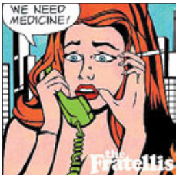
Fratellis We Need Medicine, 2013

Среди множества моих музыкальных энциклопедий была такая, автор которой не стеснялся публиковать свои личные впечатления и оценки. Не помню, о какой именно пластинке в этой книге было написано «реально раскачивает». Фраза оставалась где-то в памяти и всплыла, когда я прослушал пластинку группы Fratellis We Need Medicine.