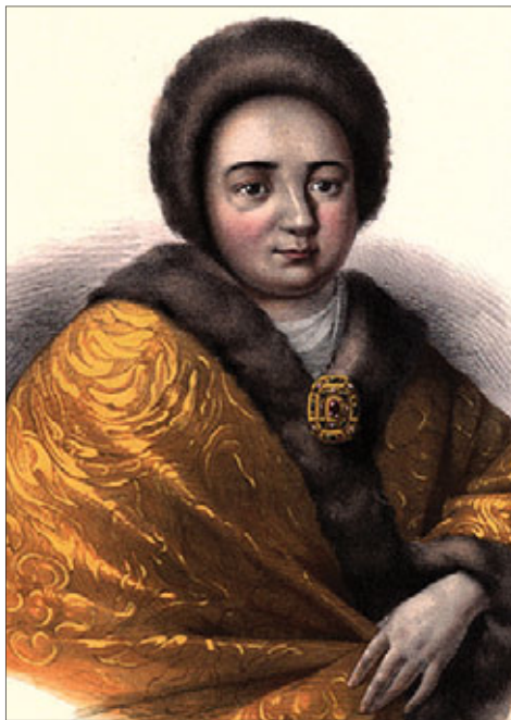
Саратовские общественники установили родственные связи Натальи Кирилловны и Сергея Евгеньевича Нарышкиных