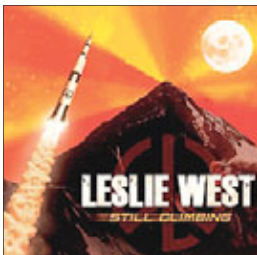
Leslie West Still Climbing, 2013

Still Climbing — «Всё еще лезу вверх» — так назвал свой новый альбом великий гитарист Лесли Уэст. И это не только отсыл к альбому Climbing (1970 год) первой группы Уэста Mountain. Это ответ скептикам и утешение фанатам, ведь в этом году музыканту ампутировали ногу. И всё равно — «Я всё еще взбираюсь на эту гору».