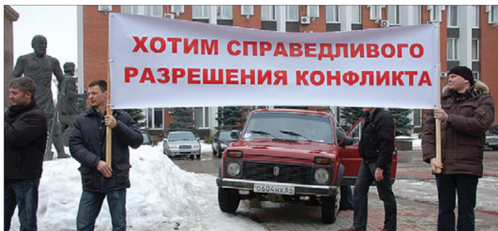
Одними воззваниями к совести властей многого не добиться

— Мне очень тяжело, мне жалко науку в России и жалко Россию, и я не понимаю тех людей, которые не осознают, какое страшное дело они творят. Но у этих людей другой менталитет, они совершенно о другом думают. Грядет национальная катастрофа, при любом исходе сегодняшних событий в академии начнется такой бардак, что всем молодым ученым я посоветовал бы поскорее бежать на Запад.