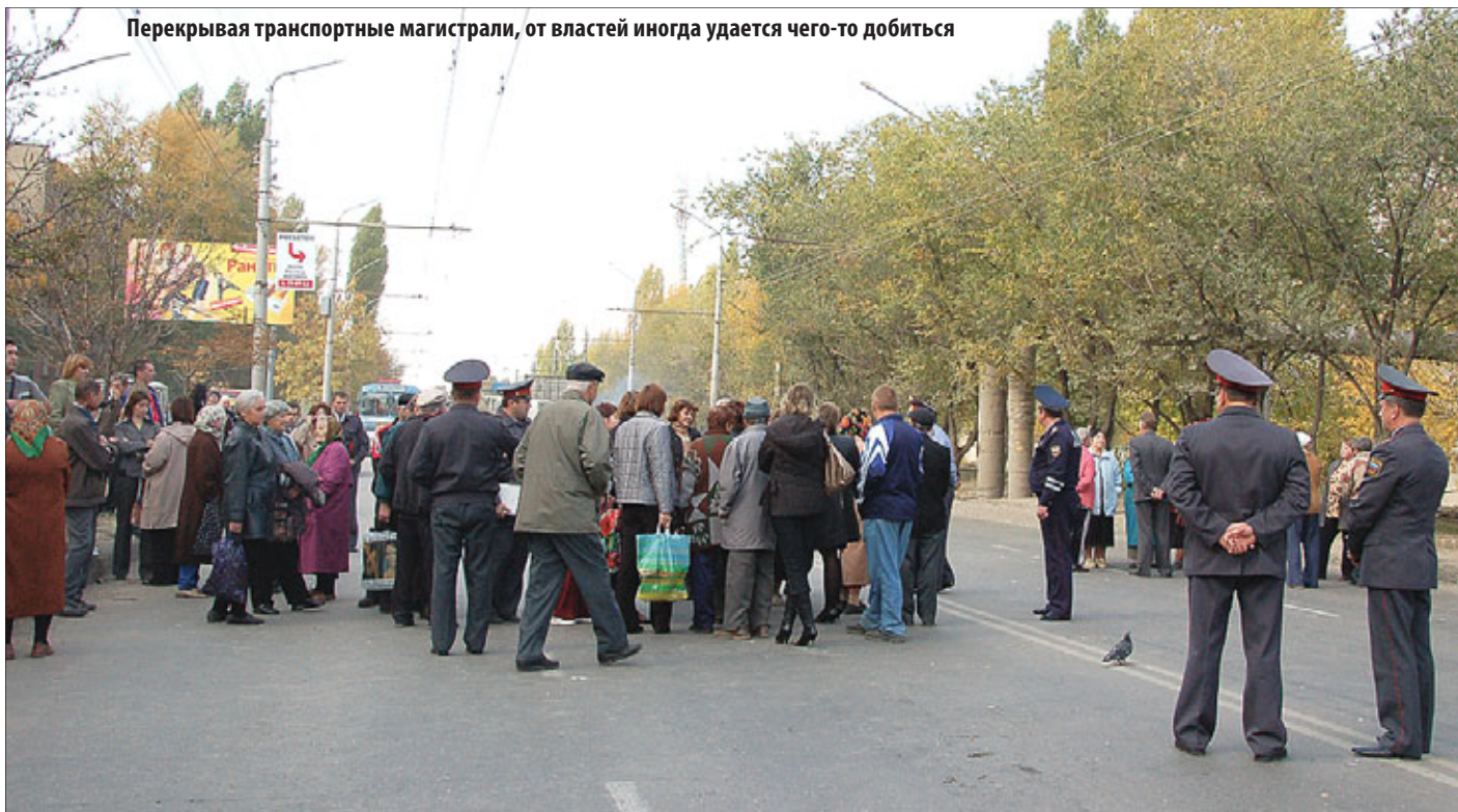
Перекрывая транспортные магистрали, от властей иногда удается чего-то добиться

Что надо сделать, чтобы обратить внимание власти на нарушение прав россиян?