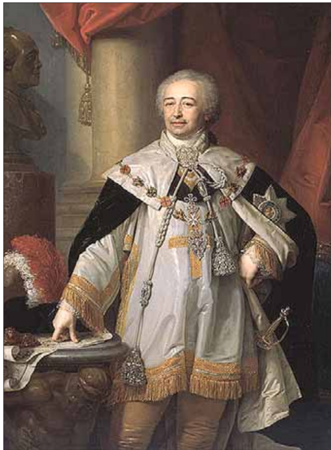
Куракин в одеянии кавалера мальтийского ордена

Мемуаристы подчеркивали его высокомерие, чрезмерное тщеславие, двуличие и страсть к обогащению, которая толкала князя на неискренние поступки, упрекали его в неспособности на истинную дружбу. Полагали, что своим «скорым и счастливым в чины происхождением» Куракин был обязан только родству с графом Паниным. Куракин, по воспоминаниям, был «всегда украшен знаками почестей» и «не принимал даже и живущих с ним иначе, как знатный господин своих доможилов».