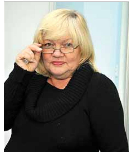
Но от глаз Свиридовой непросто укрыться

Но Лидию Свиридову возражения коллег не остановили, и она отправила письмо с аналогичной просьбой руководителю Генпрокуратуры России Юрию Чайке.