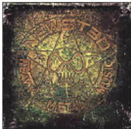
Newsted Heavy Metal Music, 2013

Экс-басист великой Metallica Джейсон Ньюстед сделал себе подарок к полувековому юбилею — выпустил пластинку своего нового проекта. Проект без особой изобретательности назван в честь его руководителя, пластинка именуется столь же незатейливо.