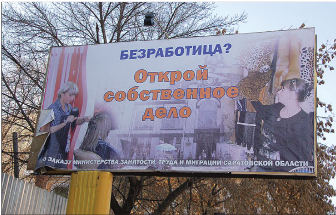
Власть уже не раз обещала предпринимателям райскую жизнь

И вот, не успело еще предпринимательское сообщество переварить это якобы послабление, как ситуация снова начала стремительно меняться. Минтруда РФ выступило с предложением со следующего года ставку взносов, которая