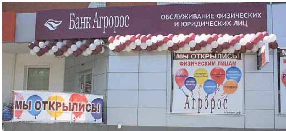
Офис «Агророса» в Энгельсе открылся

С 1 августа наши клиенты-пенсионеры могут хранить свои деньги в банке под семь процентов годовых. В 24-часовой зоне нашего офиса установлены банкомат и платежный терминал, позволяющие выполнять операции круглосуточно. Для зарплатных проектов крупным организациям мы планируем устанавливать банкоматы по городу. В честь открытия дополнительного офиса своим клиентам «Агророс» дарит подарок — бесплатное обслуживание счета до 30 сентября. Мы рады поздравить жителей Энгельса с Днем города и приглашаем в наш офис.