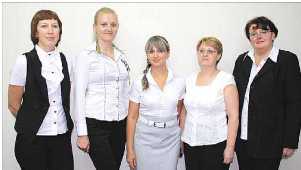
Сотрудники энгельсского офиса

Оценить уровень обслуживания и ознакомиться с полным перечнем услуг банка «Агророс» в Энгельсе вы можете по адресу: улица Маяковского, 48. Отделение работает без выходных в удобном продленном режиме. Тел.: (8453) 909-939. Сайт: agroros.pf.