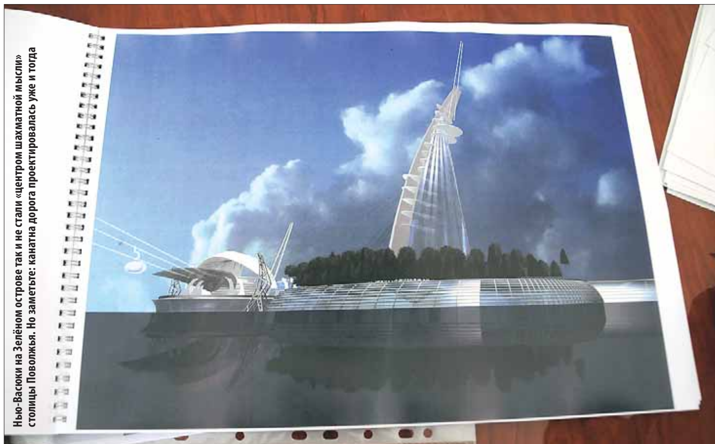
Нью-Васюки на Зелёном острове так и не стали «центром шахматной мысли» столицы Поволжья. Но заметьте: канатна дорога проектировалась уже и тогда

Чиновники с ног сбились в поисках того туманного предмета, который они сами именуют «положительным имиджем региона»