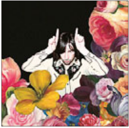
Primal Scream More Light, 2013

Слить всё в огромный чан, тщательно перемешать, иногда можно перемешивать и не особенно стараясь. Полученную смесь разлить по кубкам и чашам и смотреть, с каким удивлением народ потребляет коктейль. Примерно так я представляю себе творческий метод шотландского коллектива Primal Scream. Правда, критики уклоняются от коктейльных сравнений, бормочут что-то об эволюции инди-групп. Единственный раз я встретил разумное толкование: Primal Scream — это ревизионеры жанров. Лидер коллектива вокалист Бобби Гиллесли тоже ясны не внес. Сказал о новом альбоме: «Это запись рок-н-ролла, но современного рок-н-ролла. В значительной степени психоделик-рок, ведомый гитарами, но мы используем гитары оркестровым способом, не так, как люди обычно делают в рок-записях. Я думаю, мы идём более интересным путём. Основной звук мы создаём, сплетая гитары с электронной и прочими акустическими инструментами».