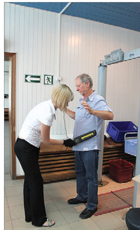
Служба авиационной безопасности проводит досмотр

— Когда я был сам пилотом, не всех сотрудников производственно-диспетчерской службы знал в лицо, — признается начальник ПДСП. — Зато различал их по голосам и знал, что они —