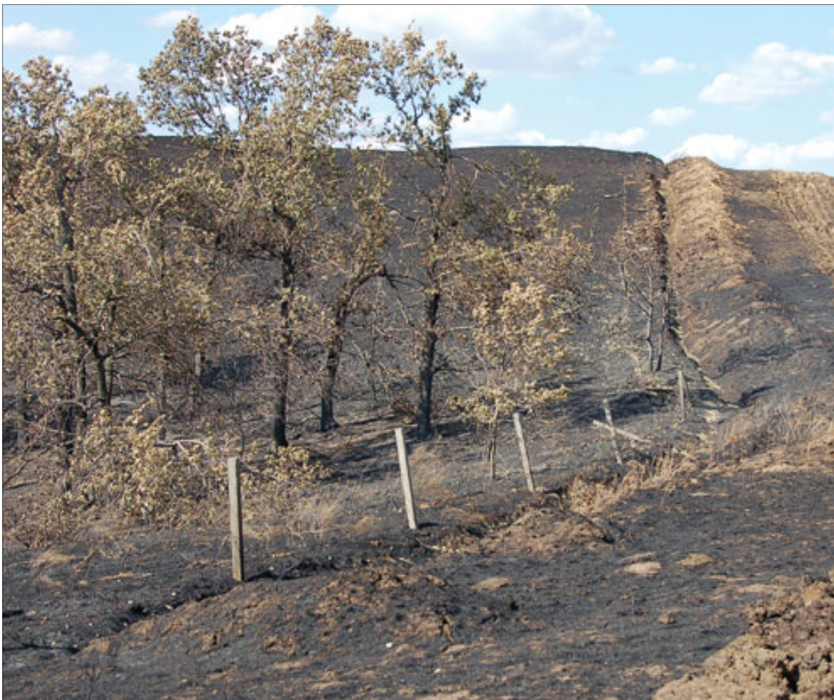
Лесные пожары в прошлые годы прошли по нескольким районам области

Если говорить о законодательной инициативе серьёзно, то для этих ограничительных мер есть веские причины. По данным Рослесхоза, девять из десяти лесных пожаров в России возникают именно по вине так называемых прогуливающих. Так что ужесточать наказание, дабы ограничить посещение лесов в неблагоприятный для прогулок период, всё же имеет смысл.