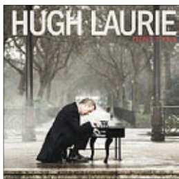
Hugh Laurie Didn't It Rain, 2013

Предполагаю, что навлеку на себя гнев многих фанатов «Доктора Хауса», но все равно делаю такой прогноз: пройдет время, и сериал забудется, и Хью Лори будут знать не как исполнителя роли гениального сумасшедшего доктора, а как блюзового исполнителя.