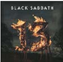
Black Sabbath «13» 2013

Новый диск родоначальников тяжелого металла, готики и многого другого еще не поступал в продажу, а разных историй о нем было рассказано немало. Самая популярная такая: продюсер Рик Рубин перед записью собрал музыкантов и включил им их же гениальный альбом Paranoid. «Вы должны вернуться к корням, вы должны записать нечто в том же духе». Ох, не тревожьте старые замшелые памятники. С самого начала воссоединившийся Шабаш стали преследовать беды. Сначала отказался участвовать в записи — по медицинским показателям — ударник первого состава Билл Уорд. На записи его заменил ударник Rage Against the Machine Брэд Уилк. Потом у гитариста Тони Йомми обнаружили рак лимфатических желез. В общем, пластинка, о записи которой стали говорить с 2001 года, создавалась 12 лет. Полклонники терпеливо ждали.