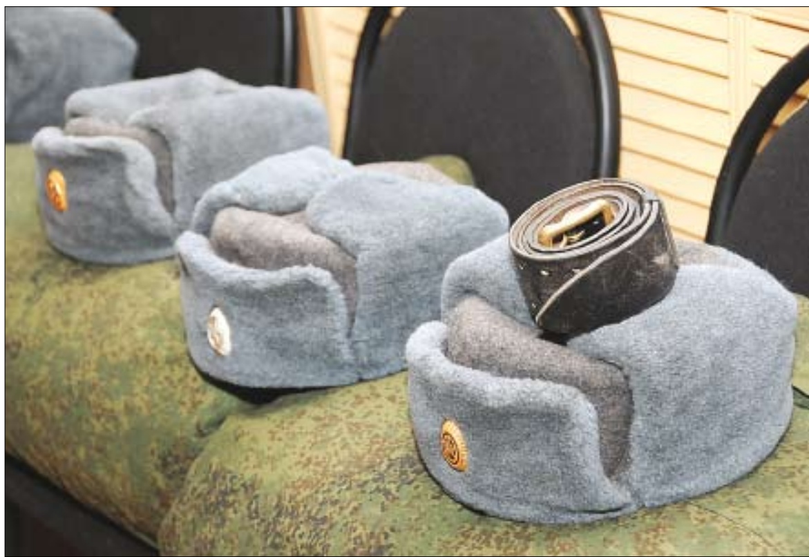
Активистам фронта нужно привыкать к тому, что там «всё должно быть однообразно и красиво»