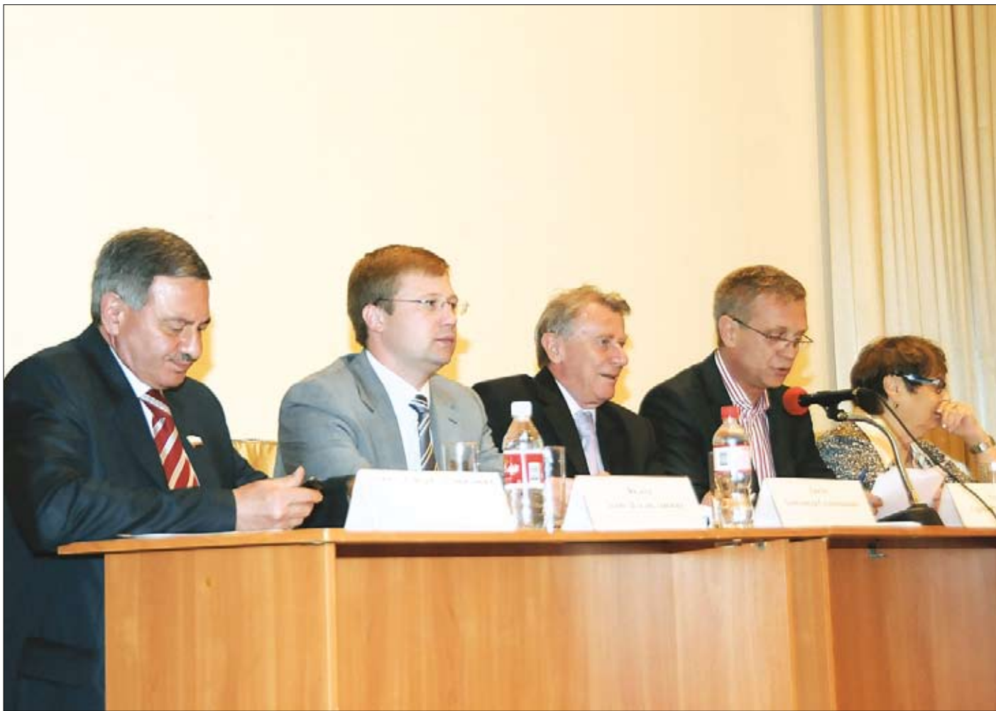
Разные люди в разные годы заседали в Общественной палате Саратовской области. Но так и не прояснили они главный вопрос: какое отношение имеет всё это к гражданскому обществу?

В обширном хозяйстве «управляемой демократии» и общественные палаты на что-нибудь сгодятся