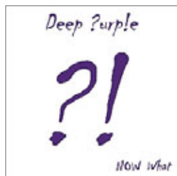
Deep Purple Now What?! 2013

Давайте поговорим о стариках. Нет, не о наших, еле сводящих концы с концами на свои скудные пенсии. Поговорим о стариках-миллионерах, ветеранах первой и второй волн рок-музыки; тех, чей пик славы пришелся на конец шестидесятых — начало семидесятых. Поводов достаточно. Род Стюарт записал новый альбом. Deep Purple выпустили свой Now What!? На подходе «13» от Black Sabbath. К этим и многим другим работам ветеранов рока можно относиться по-разному. Но никогда и ни у кого не возникнет даже малейшего повода обвинить их в халтуре. Это первое. Второе: не совсем понятны упреки, дескать, группа N не повторила своего успеха 1968 года. В отношении DP это обычно звучит так: они опять не написали Smoke On The Water. Ну и прочая ерунда об отсутствии прежнего огня, былого блеска в глазах и порывов юности мятежной. У меня на всё это два ответа. Первый: а нужен ли еще один Smoke On The Water? Ответ второй, хотя по форме — вопрос: вы часто упрекаете свою жену в том, что она не выглядит, как десять или двадцать лет назад?