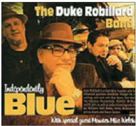
The Duke Robillard Band Independently Blue, 2013

Итак, еще один, полагаю, мало известный нашей публике музыкант — Майкл Джон Робиллард по прозвищу Дюк. Только не надо искать в моих словах некий снобизм, мол, я знаю, а вы — неучи — нет. У меня самого это только второй диск Дюка в коллекции.