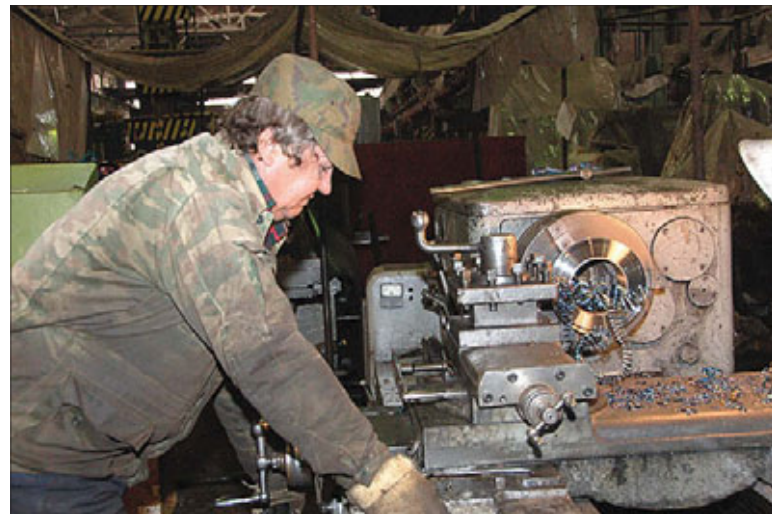
Почти исчезающая фигура — квалифицированный рабочий

дров, ни рубля не вкладывая в развитие системы профобразования? Зарплата рабочего станет адекватной его труду и достаточной для удовлетворения его нужд? Выпускники придут на предприятия с желанием работать, а не просиживать штаны за получку?