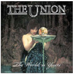
Union The World Is Yours, 2013