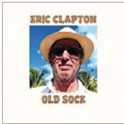
Eric Clapton Old Sock, 2013

В былые времена все рецензии на этот альбом начинались бы так: «Вышел новый КЛЭПТОН!» Сейчас же тон иной — ну вышел новый Клэптон, надо бы похвалить старика, хотя, конечно, он уже не тот. Собственно, это старая тема: должны ли гиганты 60-х и 70-х кому-то и что-то доказывать? Уверен, ни в коей мере не обязаны. Они всё уже доказали и вошли в пантеон звезд современной музыки. И надо благодарить, что они не повесили свои гитары на гвозди, а время от времени радуют поклонников новыми работами.