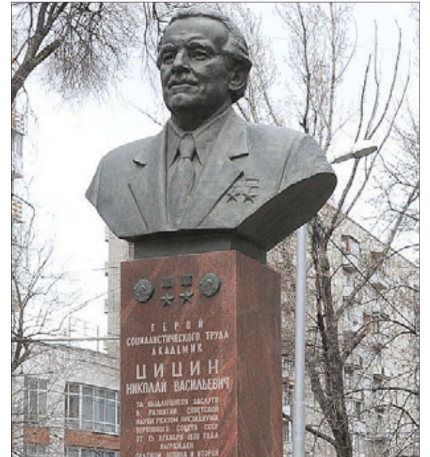
Дважды Героям Социалистического Труда ставили на их родине бронзовые бюсты — памятники при жизни

В российской истории можно, правда, найти и более интересные для подражания примеры. Кто помнит о том, что практически до Петра I в России была традиция награждать отличившихся мелких чинов монетами? И носили они их или на рукаве, или на шапке. Ну а уж Петр начал мудрить с наградами, превращая их в инструмент укрепления господства правящего класса. Обладатели «царской милости» становились опорой престола, получая льготы и привилегии. Исследователи истории прямо говорят о том, и награды, и льготы уже к XIX веку представляли собой в основном своеобразный вид подкупа. Так что и с этой точки зрения, похоже, ничего не изменилось.