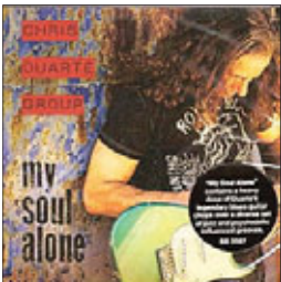
Chris Duarte Group My Soul Alone, 2013

Настоящий блюзмен должен упиваться мировой грустью. Должен понимать, что жизнь, в сущности, отвратительна. И против этого есть только один способ: топить, что называется, тоску в стакане. Предыдущие поколения так и поступали. В результате Роберт Джонсон просто пропал, Рой Бьюкенен повесился в полицейском участке, Рори Галлахер умер в сорок семь после пересадки печени. Последним положил свою жизнь на алтарь blues & whiskey Гэри Мур.