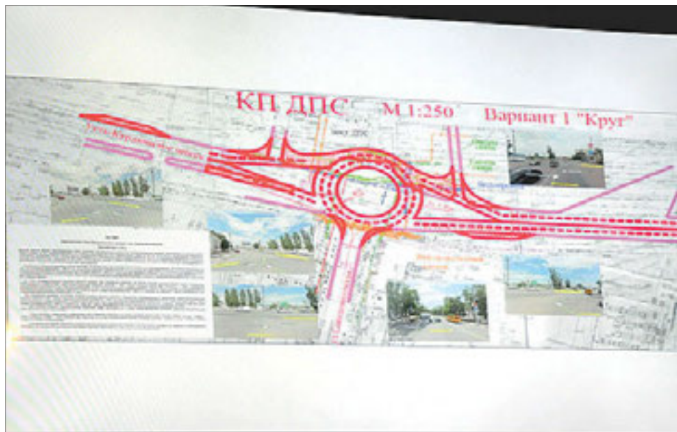
Развязка ул. Соколовская — Усть-Курдюмское шоссе