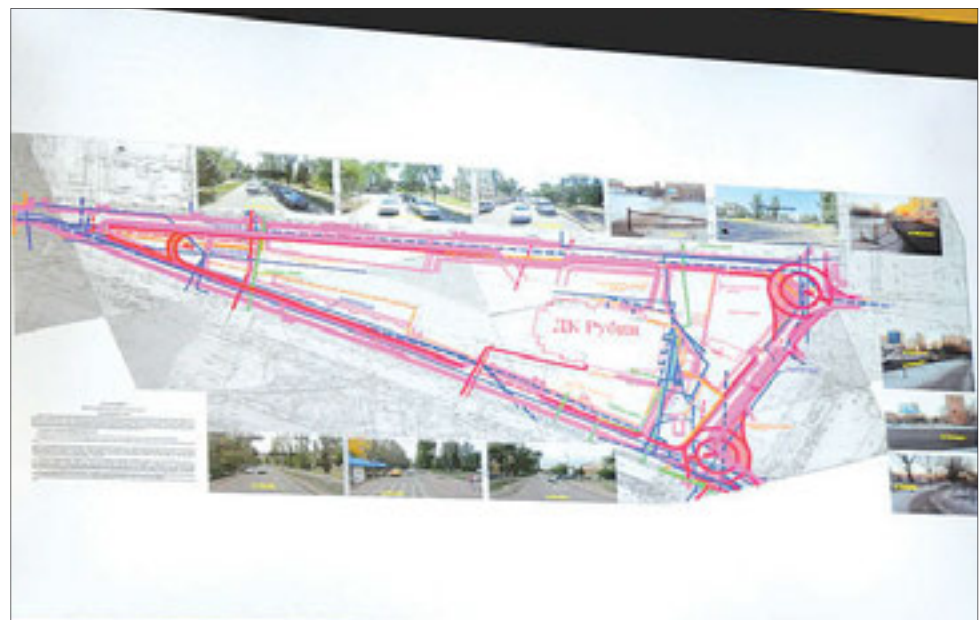
Развязка вокруг ДК «Рубин»