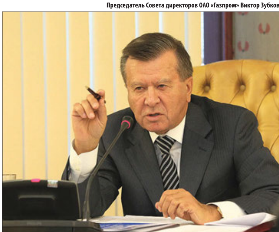
Председатель Совета директоров ОАО «Газпром» Виктор Зубков

Анализ показывает, что одна из главных причин роста задолженности ОКК — это создание посредников в цепочке расчетов за потребляемый природный газ (включая газовую составляющую в тепловой энергии) в виде недобросовестных управляющих компаний. Денежные средства населения далеко не в полном объеме доходят до тепло- и ресурсоснабжающих организаций, что в большей степени связано с нецелевым расходованием поступающих средств. А в ряде случаев просто с их откровенным разворовыванием. На проходившем 12 марта селекторном совещании по вопросам укрепления платежной дисциплины при оплате газа Председатель Совета директоров «Газпрома» Виктор Зубков назвал вещи своими именами, говоря о «жульнических» схемах, которые применяются в ЖКХ. Уже классической стала схема, когда компания с уставным капиталом в 10 тысяч рублей получает в управление муниципальное имущество и оборудование, собирает