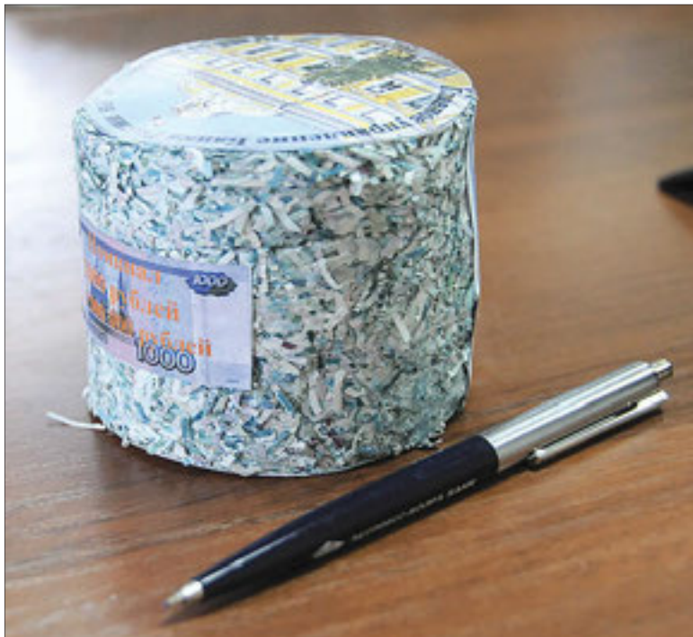
В цилиндрике из нарезки тысячных купюр спрессовано полмиллиона рублей — теперь уже бывших

Руководителей коммерческих банков губернатор попросил при оценке необходимости ликвидации того или иного офиса в сельской местности в случае его нерентабельности взвешенно подходить к принятию данного решения. Потому что многие банки несут еще и социальную нагрузку, так как с их помощью сельское население может оплатить счета, получить переводы, пенсии. Еще губернатору не нравится, что банки в своей кредитной политике всё больше ориентируются на розницу — «рост кредитования реального сектора экономики замедлился и в два раза отстает от роста потребительского кредитования». «Призываю банковское сообщество активно поддерживать развитие бизнеса. И банки в этом случае получат новые перспективные клиентов — вкладчиков, платежеспособных заемщиков, владельцев пластиковых карт», — сказал он.