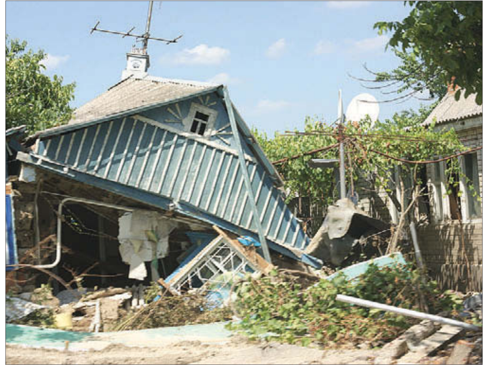
В разрушенный наводнением Крымск волонтеры прибыли незамедлительно

так боятся принятия этого закона. Потому что согласно ему зеленый свет получают прокремлевские организации. Истинные же добровольцы останутся не у дел.