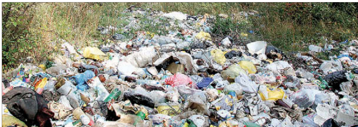
Вряд ли статистика знает всё о множестве мелких незаконных свалок

В настоящее время администрации тех районов, где по плану должны строиться мусороперегрузочные станции, занимаются подбором подходящих инвесторов участков. Главное условие, как рассказали «Газете недели» в комитете