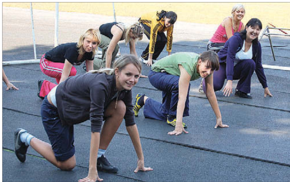
В мудром деле реформирования от старта до финиша иногда бывает один шаг

Поэтому, как говорят в областном министерстве, оптимизация была задумана с целью грамотно и как можно более прозрачно распределить бюджетные средства и дать возможность развиваться спортшколам олимпийского резерва. Но как обеспечить финансирование спортсменов из тех школ, которые находятся в ведомстве муниципальной власти? Только через школу высшего спортивного мастерства. Поэтому тех, кто занимается в муниципальных СДЮСШОР, оптимизация не коснется. Также в обойме ШВСМ остаются те спортсмены, которые выступают в параллельном зачете. Всего 14 человек.