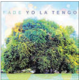
Yo La Tengo Fade, 2013

Вот и подросла первая пластинка этого года — диск американской группы Yo La Tengo под названием Fade.