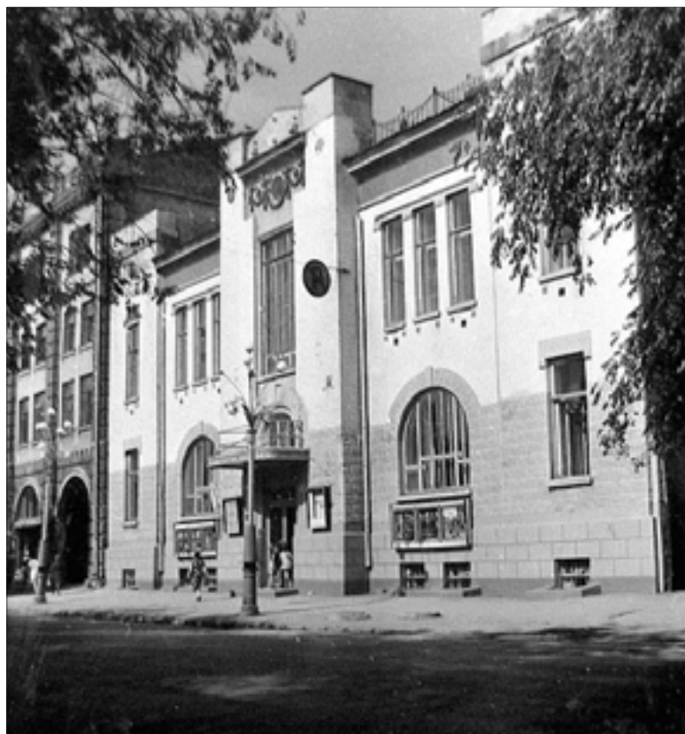
Вид здания Саратовского ТЮЗа в 70-е годы 20 века

Татьяна Бондаренко, сотрудник Государственного архива Саратовской области