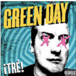
Green Day Trel 2012

Позволим себе должностное преступление: пропустим второй альбом из трилогии Green Day. Отметим только, что получился он не таким примитивным, как первый, а последняя вещь — нежна я баллада Amy с осязательными битловскими интонациями — стала переходным мостиком к последней части трилогии.