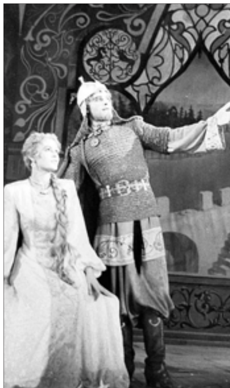
Сцена из спектакля «Золотое сердце», 1951 год