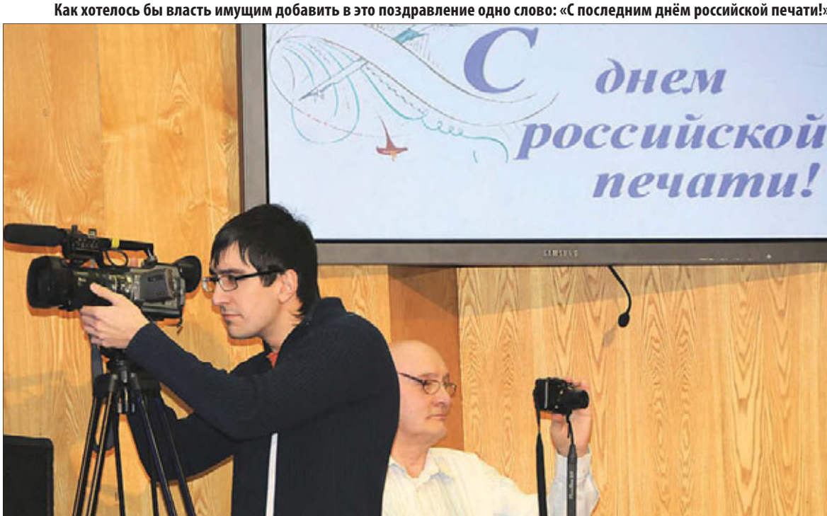
Как хотелось бы власти имущим добавить в это поздравление одно слово: «С последним днём российской печати!»

Власти всё реже хочется прерывать молчание. И если «Репортеры без границ» в идят г лавную проблему российской журналистики в усилении репрессий, то любой провинциальный журналист скажет, что главная наша проблема — дозирование властью информа-