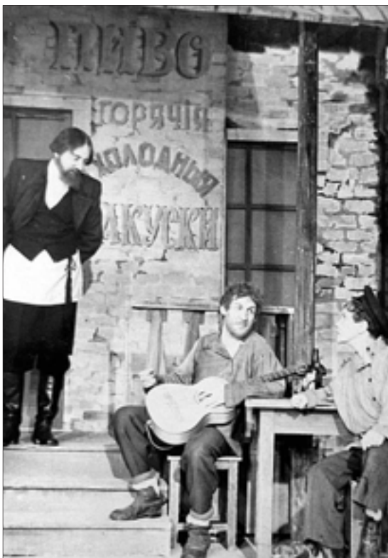
Сцена из спектакля «Алеша Пешков», 1951 год