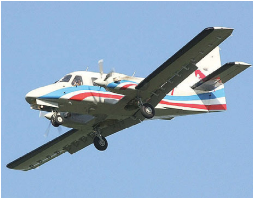
Первый прототип самолета «Рысачок» (серийный номер 00-01, бортовой номер 777) в полете на МАКС-2011. Жуковский, 15.08.2011