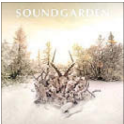
Sound Garden King Animal, 2012

Может, это предположение и спорно, но представляется, что именно грандж является тем музыкальным стилем, который уже сдан в музей рока. Конечно, Nirvana бессмертна, а ее лидер гениальный и трагичный Курт Кобейн велик. И навсегда обосновался в пантеоне современной музыки. Но кто помнит, что начинала Nirvana не одна, что рядом было неск олько с толь же талантливых команд? Разве что только фанаты. И вот в конце прошлого года Sound Garden, коллектив, который по праву можно считать одним из основателей направления грандж, решил напомнить о себе. По странному стечению обстоятельств это третья в 2012 году группа, которая решилась на камбек спустя шестнадцать лет молчания. Какое-то магическое число.