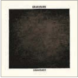
Graveyard Lights Out, 2012

Как вы лодку назовете, мол, так она и... Как бы не так. Была, например, английская группа под названием Joy Division. Затрудняюсь перевести досконально точно, что-то вроде «Бригада радости». Есть версия, что так назывались публичные дома для солдат в годы войны. Но не суть. Так вот, «радостная группа» исполняла максимально депрессивную музыку, выпустила две наимрачнеешие пластинки, а потом ее лидер Йен Кёртис покончил с собой. Но это было на рубеже семидесятых-восьмидесятых.