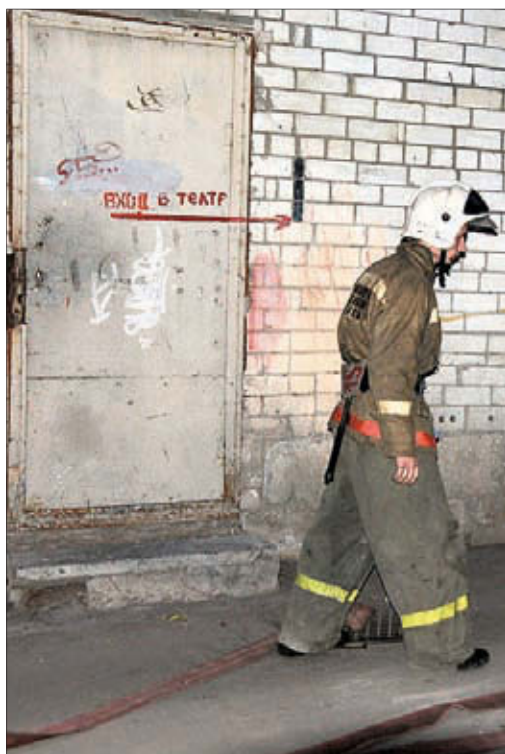
Увы, не премьера «Капитанской дочки» стала самым громким событием в жизни Театра юного зрителя