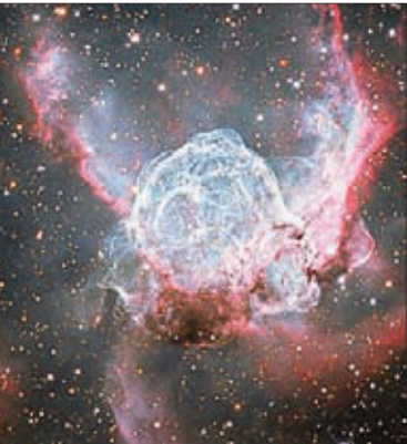
Туманность, известная как «Шлем Тора», плывёт в 15 тысячах световых лет от Земли в созвездии Большого Пса. Облако пыли и газа приобрело живописную форму благодаря излучению массивных звёзд, расположенных внутри него. Фотография сделана в мае 2012 года.

Особенную уник альность времен, в которых мы живем, астрологи объясняют завершением самых разных циклов. Д ля обы чного современного че ловека любые попытки объяснить их понятными словами будут звучать какими-то отголосками из г лубокой древности или обрывками из книжек и фильмов в стиле фэнтези.