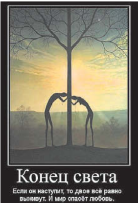
Конец света Если он наступит, то двое всё равно выживут. И мир спасёт любовь.

А что если предположить, что однажды кто-то зачем-то решил поместить всю силу человеческой веры в одну систему координат, предложив всем подумать о лучшем для всех и каж-