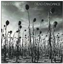
Dead Can Dance Anastasis, 2012

Это реально великий камбек. Спустя 16 лет Брендан Перри и Лиза Джеррард вернулись к слушателям с замечательным альбомом.